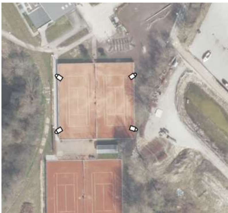
Figur 1 - Omtrent placering af lysmasterne

Lysanlægget bliver udstyret med et kontaktur, således lyset ikke tændes, når banen ikke er i brug. Lysmasterne kan udelukkende tændes af medlemmer, der har adgang til klubhuset. Den konkrete type af lysanlæg der ønskes opsat kan ses i bilag 1.